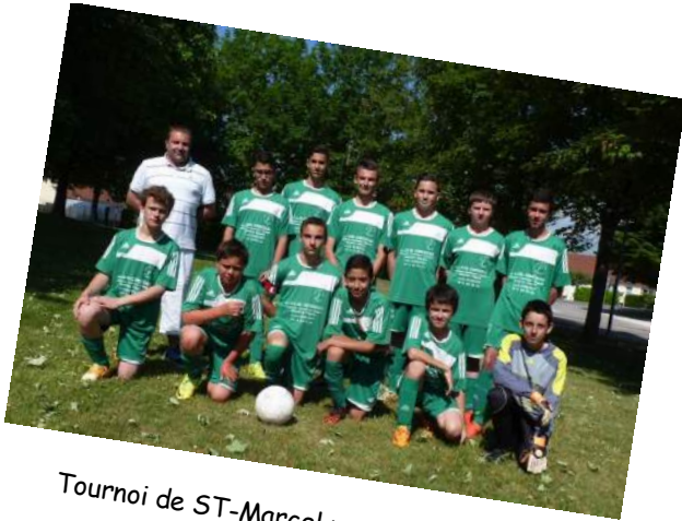
Tournoi de ST-Marcel pour nos U14-U15