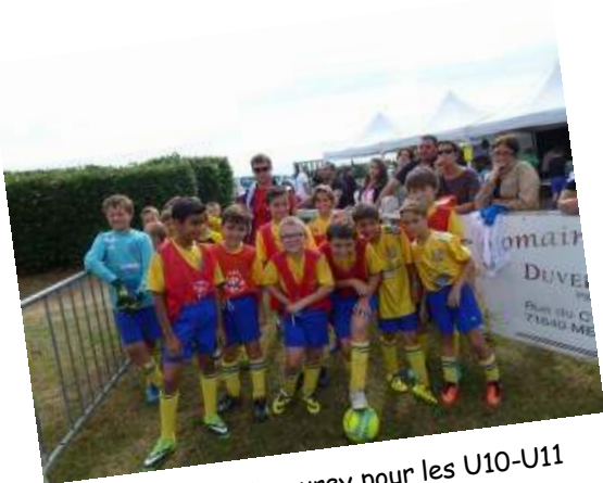
Tournoi de Mercurey pour les U10-U11