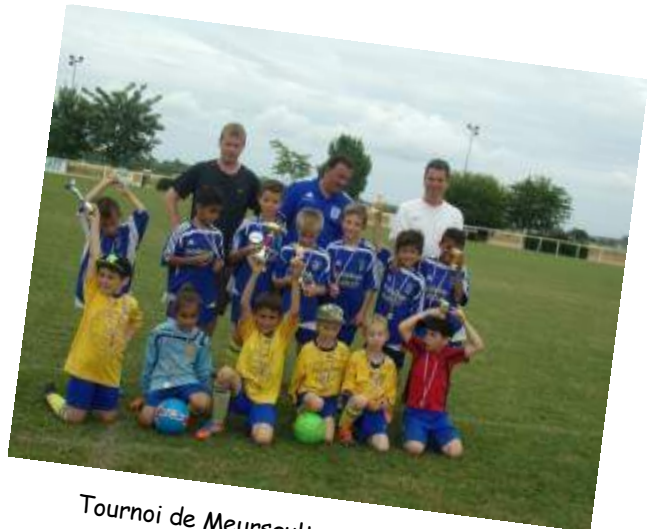
Tournoi de Meursault pour les U8-U9