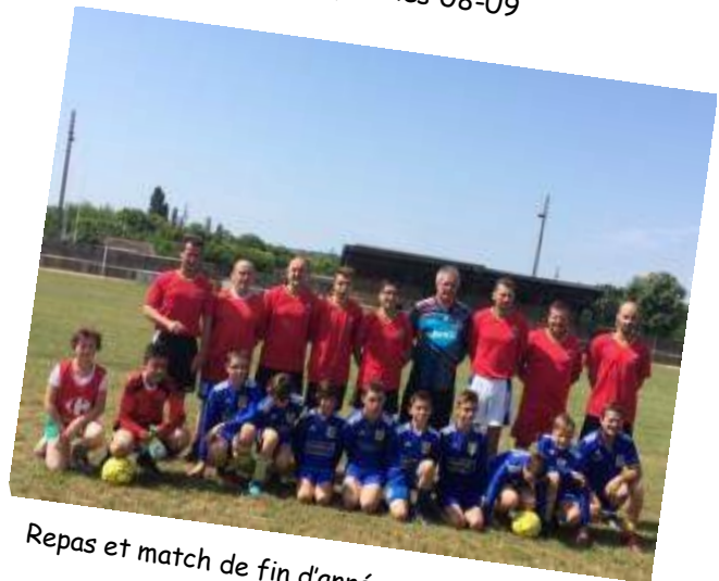
Repas et match de fin d'année pour les U12-U13