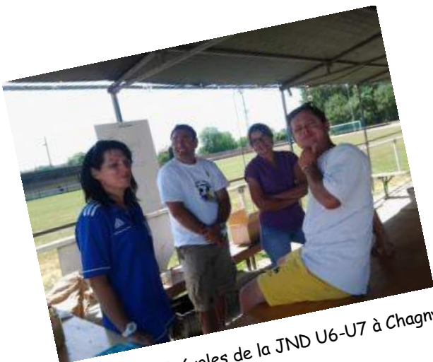
Une partie des bénévoles de la JND U6-U7 à Chagny