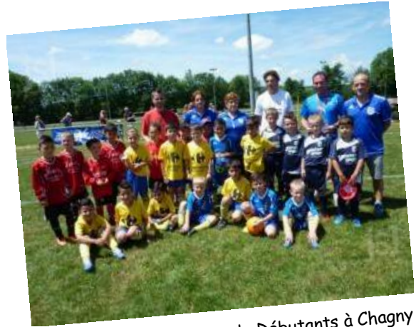
U6-U7 à la Journée Nationale Débutants à Chagny