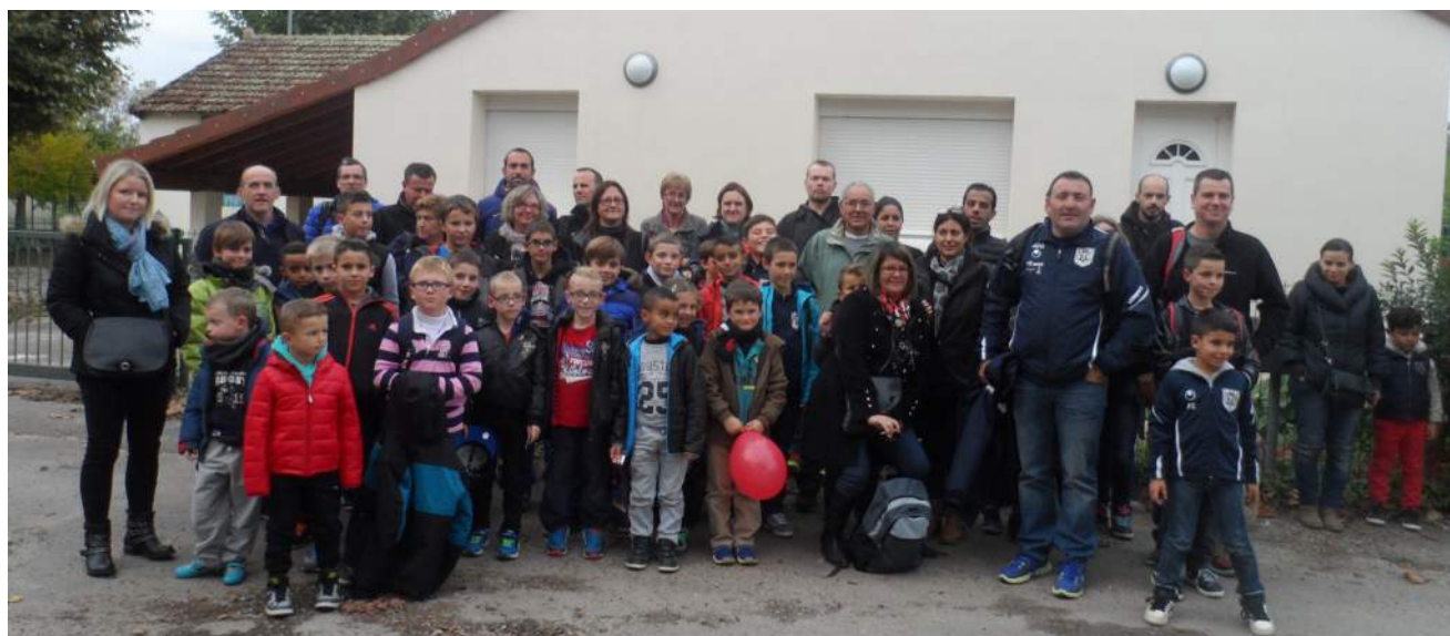
Les 59 personnes présentes à cette sortie festive lors de notre retour de Dijon.