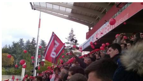
Animation d'avant match.