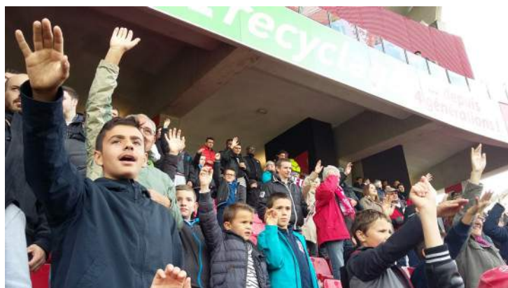
Nos Chagnotins encourageant les Dijonnais !