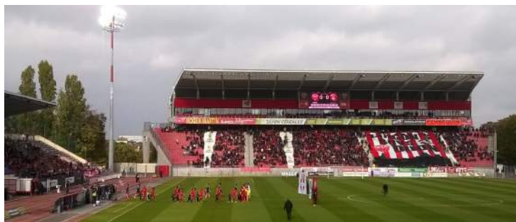
Stade Gaston Gérard , entrée des 2 équipes.