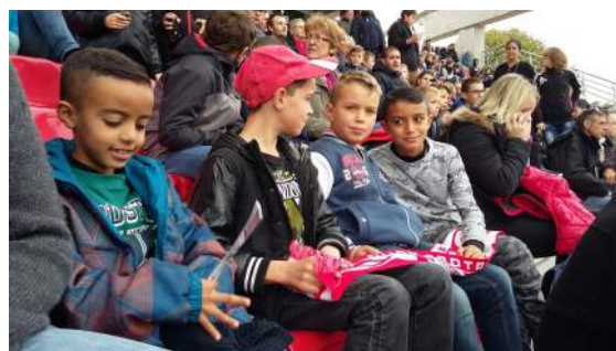
Tous unis entre catégories.