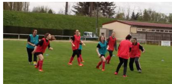
Séance d'entraînement des féminines