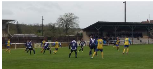
Seniors contre SVLF