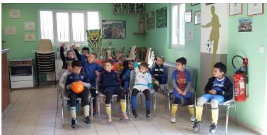
Programme éducatif fédéral avec les U7