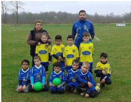
U7 à Epervans