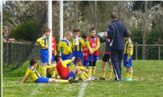
U11 à Givry